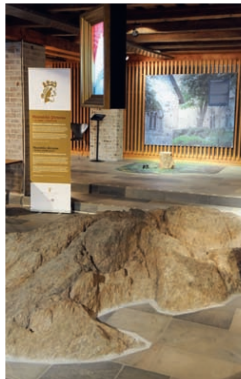
Frå utstillinga Miserabilis Personae i kjellaren på St. Petri kyrkje.

Brevet som biskop Torgils skreiv om opprettinga av hospitalet til Peterskyrkja i Stavanger, viser til fattigflyttingsordninga. Her heiter det at på hospitalet skal «ein leggje inn dei fattige som blei sjuke i byen, for at dei der