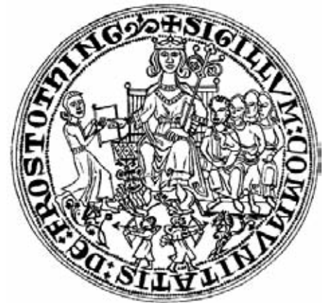
Frostatingsseglet viser Kong Magnus Lagabøter som gjev Landslova til lagmannen på Frostating. Det skjer på Botolvsmesse (det var på Gulating at lagtinget møtte til Jonssok).

Torvingsregelen i Frostatingslova var ikkje vidareført i Landslova. Men regelen om at ein kunne pryla småtjuvar vart derimot delvis vidareført. Etter Landslova var ordninga slik at ein primært skulle betala bot for slike småtjuveri, men måtte akseptera ein omgang juling om ein ikkje hadde noko å betala med. 20 Den store endringa var likevel at no gjaldt regelen bare for dei som kunne ta seg arbeid for å fø seg sjølv. For etter Landslova var det ikkje tjuveri om den som stal ikkje kunne få seg arbeid, og stal mat for å berga